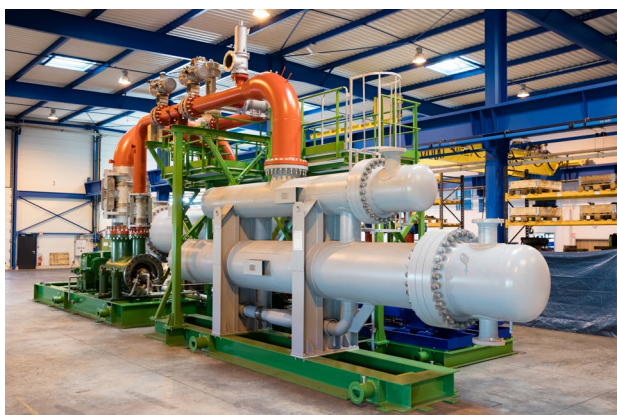
Module ORC 3500 kWe - Acierie Baosteel, Shanghai, Chine

Enertime réalise des modules ORC sur-mesure adaptés aux besoins et contraintes de ses clients : ajustement à la puissance thermique disponible, fluides spécifiques (huile thermique, vapeur, eau surchauffée), intégration dans un espace limité ou aux contraintes d'accessibilité particulières.